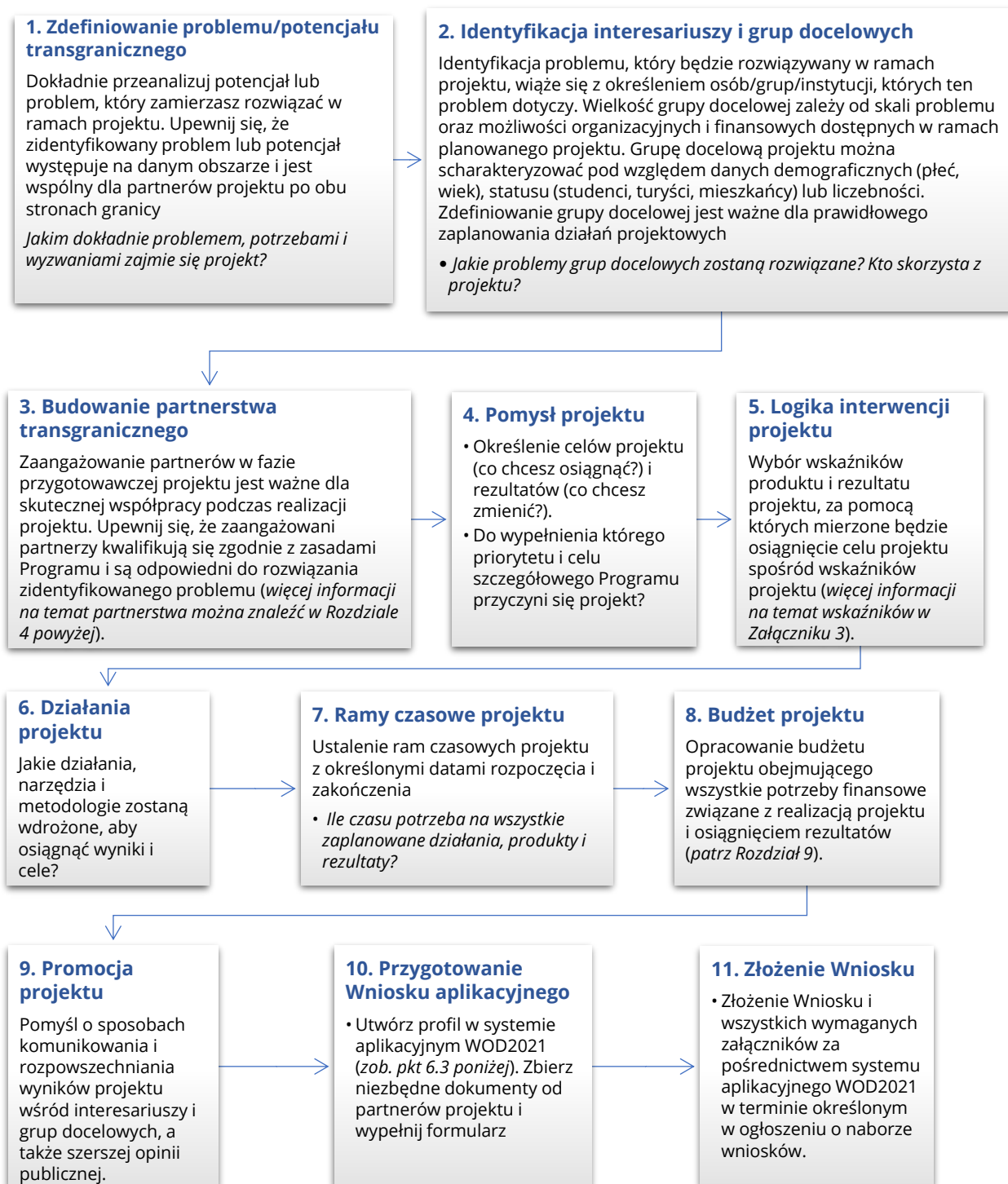
Rysunek 1. Jak przygotować projekt krok po kroku