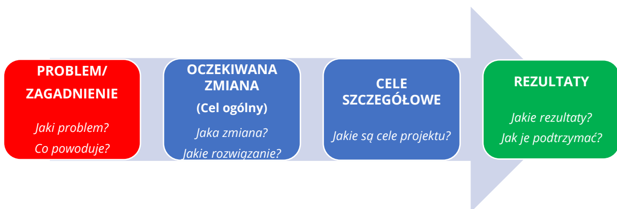
Rysunek 2. Jak opracować logikę interwencji projektu

Logika interwencji projektu powinna być zbudowana zgodnie z procesem przedstawionym na poniższym rysunku, który zawiera również powiązane podstawowe pytania, na które należy odpowiedzieć podczas tego procesu.